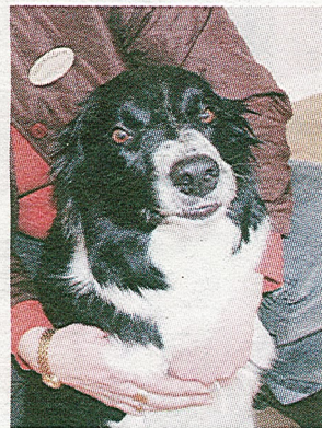
LUGNAR. Hunden Enya ska hjälpa till att göra Grindstolpens kunder avspända.

gare är dock speciellt, konstaterar hon.